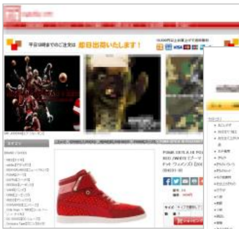
スポーツ用品を販売するサイト

11月は新たな分野で、さまざまなオンライン通販の詐欺サイトが検知されました。時計や服飾などの有名ブランド品の詐欺サイトは従来から多数検知されていますが、11月は「着物の生地」「スポーツ用品」「自転車・自転車用品」など、より趣味性の高い商材を用いた詐欺サイトが出現しました。スポーツ用品などは、クラブ活動をしている学生や未成年者を含む幅広い層をターゲットとしており、過去にも子どもがお小遣いやお年玉を使って詐欺サイトに代金を支払っても商品が送られてこないなどの被害も報告されています。悪徳商行為に慣れていない未成年者は「激安」「限定品」「数量限定」などのあおり文句にだまされやすいこともあり、オンラインショッピングをしやすいスマートフォンやタブレットの普及によって、その危険性はますます高くなってきていると考えられます。また、犯罪者はどの分野が効率よく金銭を搾取できるかを試していると考えられ、今後もさまざまな趣味分野の詐欺サイトが出現すると考えられます。