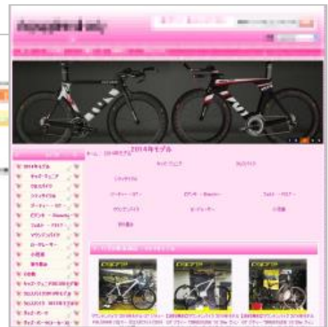
自転車を販売するサイト