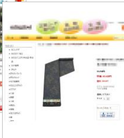
着物の生地を販売するサイト