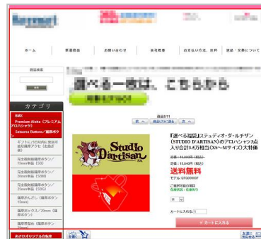
アロハシャツの福袋販売サイト