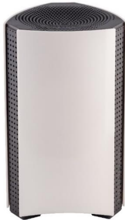
ハードウェア正面