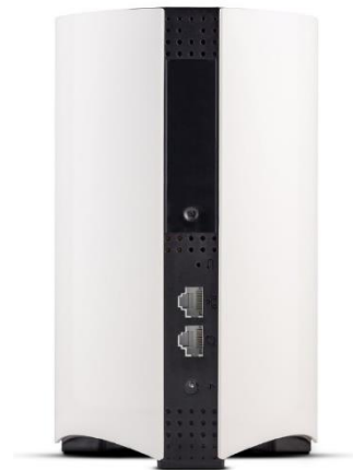
ハードウェア背面