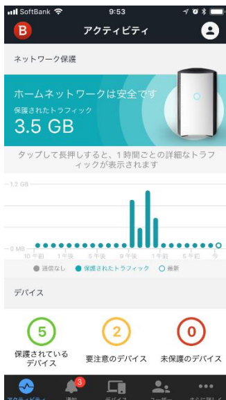
アクティビティー