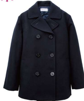
【人気No.4】ピーコート(男女兼用) KANKO Harajuku Select

幅広の襟がかっちりした印象で制服との相性が良く、すっきりとしたデザインのピーコート。表生地は高級感のあるメルトン、 裏地は中綿入りのキルト裏地 を採用しています。