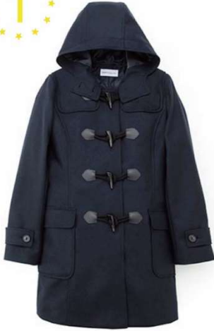
【人気No.1】【軽量】国産 ダッフルコート KANKO Harajuku Select

カンコーオンラインショップのロングダッフルコートでは 最軽量 ！表生地は軽量のソフトメルトン、裏地は中綿入りのキルト裏地を採用し、 軽さと暖かさの両方を兼ね備えています 。前合わせにはファスナーを採用しているので、冬の冷たい風の侵入を防ぎます。