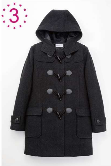
【人気No.3】定番 ダッフルコート KANKO Harajuku Select

スクールコートで一番人気はベーシックなロングダッフルコート。表素材は高級感のあるしっかりとしたメルトン、 裏地には保温性のあるキルト裏地 、風の侵入を防ぐ前ファスナーで寒い冬も安心！チラリと見える袖の裏地にはストライプ柄でさりげない可愛さもあります。