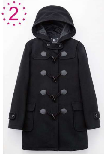
【人気No.2】ダッフルコート SWEET TEEN

学校校則で色の指定があっても安心な紺、黒、グレーの3色展開です。 表素材は高級感のあるしっかりとしたメルトン 、前合わせには 風の侵入を防ぐファスナー付き です。