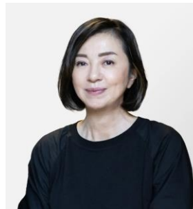
審査員長 織作 峰子 写真家/大阪芸術大学 教授 写真学科 学科長