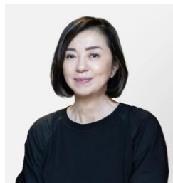
審査員長 織作 峰子 写真家/大阪芸術大学 教授 写真学科 学科長