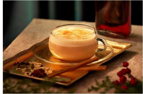
ラム酒香るアッサムチャイ HOT ※アルコール飲料 イートイン 800円/テイクアウト 600円