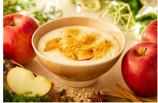
スパイス香るアップルチャイ HOT イートイン 800円/テイクアウト 650円