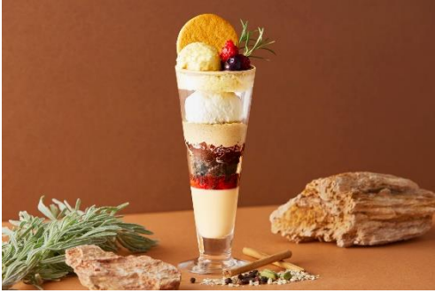
スパイス香るチャイティーパフェ イートイン限定 1,200円 (ストレートチャイティー付き)