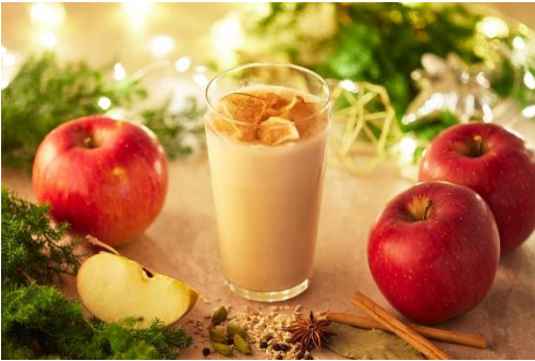
スパイス香るアップルチャイ ICE イートイン 800円/テイクアウト 650円