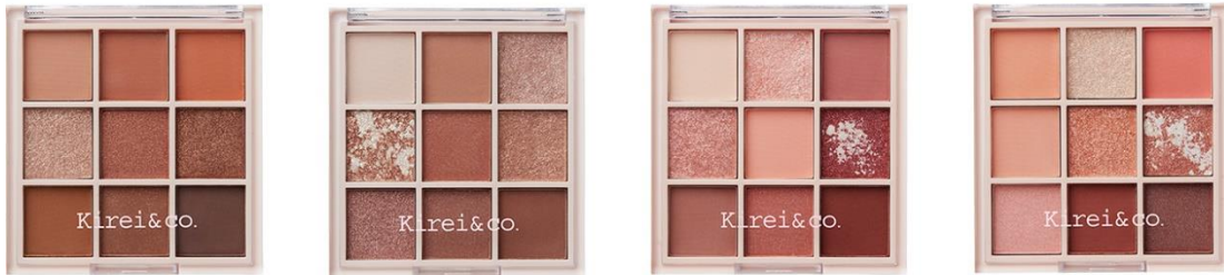
01 オレンジブラウン

■アイシャドウパレットひとつでマット・シアーマット・パール・グリッター・ラメの多彩な質感とカラーバリエーションが楽しめる 9 色アイシャドウパレットです。肌にぴたっと馴染み、発色の良さが続きます。