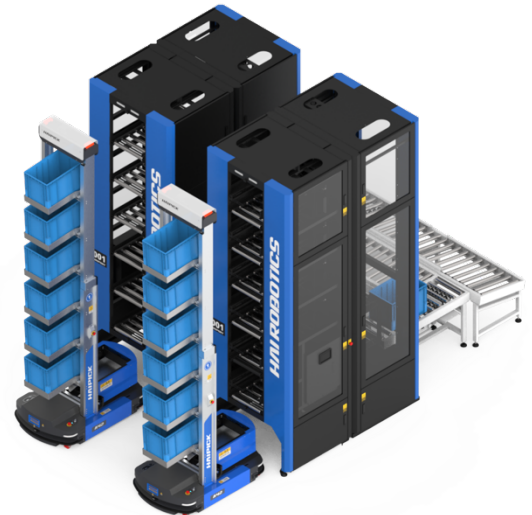
多機能ワークステーション