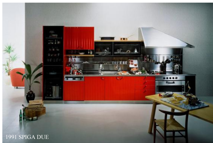
1991 SPIGA DUE