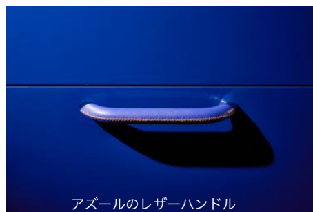
アズールのレザーハンドル