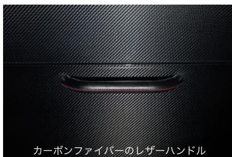
カーボンファイバーのレザーハンドル

「カーボンファイバー」、「アズール」のためのレザーハンドルは、無垢のアルミの重厚感に、手作業で仕上げられた本革の温もりが融合し、洗練された美しさを実現。熟練の職人が一針一針丁寧に施したステッチは、まるでキッチンに命を吹き込むよう。アズールでは、レザーとステッチの組み合わせは好みに合わせてカラーカスタマイズが可能です。レザー42色、ステッチ14色をご用意しています。ディテールの美しさにもこだわる私たちの哲学が息づいています。