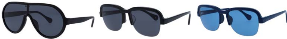
(左からシールド K、ライン K、ライン K)

ファビオ・ノヴェンブレは、アンナ・カステリ・フェリエリがデザインしたミラーからインスピレーションを得て、非常に個性的なシールド K | SHIELD K とライン K | LINE K のコレクションをデザインしました。フレームとレンズをトーン・オン・トーンで組み合わせ、カラーを効果的に使っています。