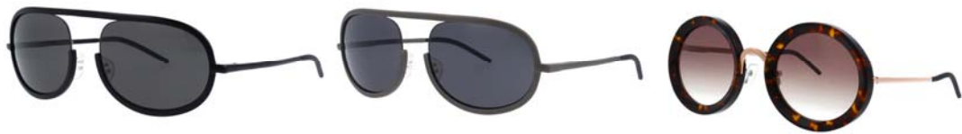
〈左からルーク 01、ルーク 01、ルーク 02〉

ルークは、メンズとレディースのメガネのコレクションです。その名の通り、丸みを帯びたしなやかなフォルムは、対照的な素材と色によって顔のラインに合うように作られています。クラシックな伝統にインスパイアされながらも、このメガネは非常に個性的な表情を持っています。