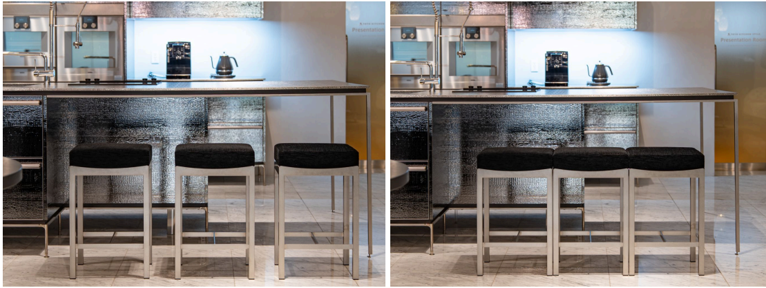
左：一脚ずつ離して置いた場合