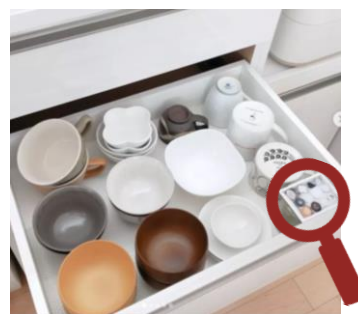
家事ハック大賞グランプリ