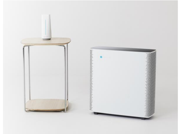
ブルーエアセンスプラス&アウェアセット

※Camfil 社による実証データ。実際の効果は、部屋の状況やご使用方法により異なる。