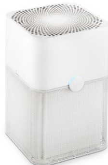
Blue By Blueair シリーズ