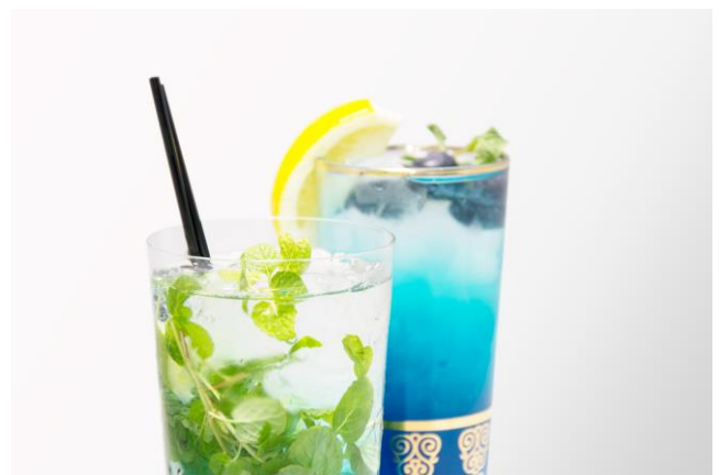
ブルーモヒート (手前) とココナッツカイピリーニャ (奥)