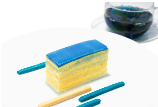
ブルーレモンケーキとブルーフラワーハーブティー