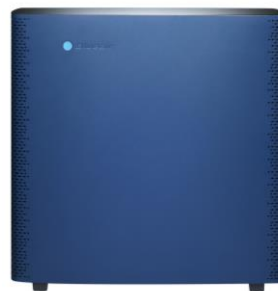
Blueair Sense +シリーズ