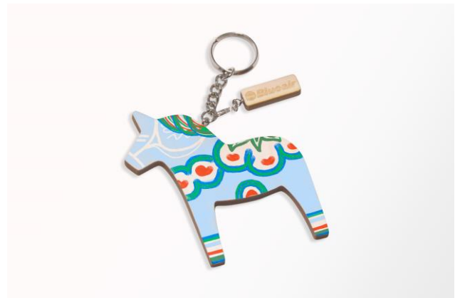
ブルーエアオリジナルのダーラナホース (完成イメージ)

スウェーデン・ダーラナ地方で 18 世紀に生まれたといわれる木彫りの馬「ダーラナホース」に、マジックやかわいいシールなどでデザインするワークショップを開催。ダーラナホースは、民芸品としても人気が、幸せを運んでくれる馬と言われています。ぜひお子様連れでお越しいただき世界に一つだけのキーホルダー作りをお楽しみください。