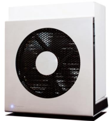
ブルーエア ミニ空気清浄機