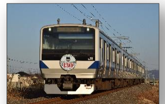
(ヘッドマーク列車イメージ) ※本キャンペーンのデザインとは異なります。