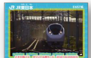
(鉄カードイメージ) ※本キャンペーンのデザインとは異なります。

【参考】鉄カードとは 鉄カードとは、全国各地の鉄道会社が共通のデザインで作成するトレーディングカードです。 2019年10月には、国土交通省が選考している日本鉄道大賞を受賞しています。