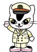
JR 東日本水戸支社 E657系イメージキャラクター ムコナくん

〈ユーザー名〉@jre_mito_657 ( https://twitter.com/jre_mito_657 )