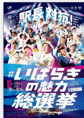
▲ポスターイメージ