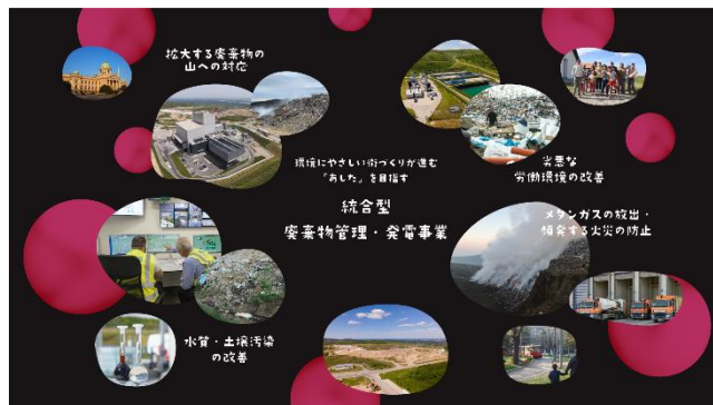
※体験イメージになります