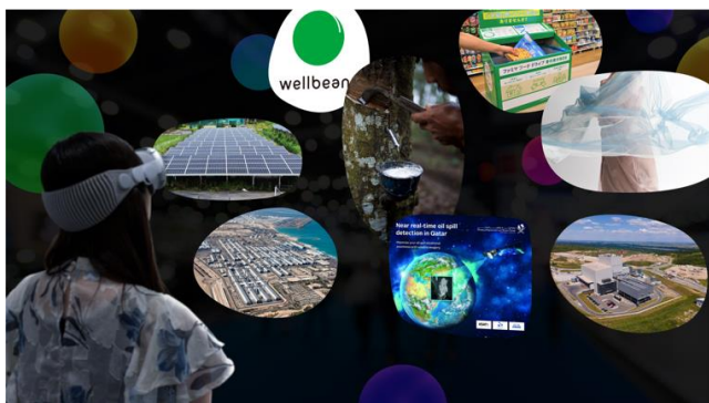
※体験イメージになります

Apple Vision Pro は、デジタルコンテンツを現実空間にシームレスに融合する最先端の空間コンピュータです。本展示では、伊藤忠の商人たちの8つの“あした”に向けた取組を Apple Vision Pro を通した最新の体験・演出でご紹介します。従来の展示とは一味違う、リアルとデジタルが融合した新しい展示体験をお楽しみください。