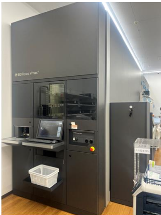
BD Rowa™ システム (左) BD Rowa™ EasyLoad 全自動入庫システム (右)

また、「BD Rowa™ EasyLoad」は、当社従来品と比べ、入庫にかかる時間を 1 箱あたり約 10 秒短縮し、稼働音も静かになります。