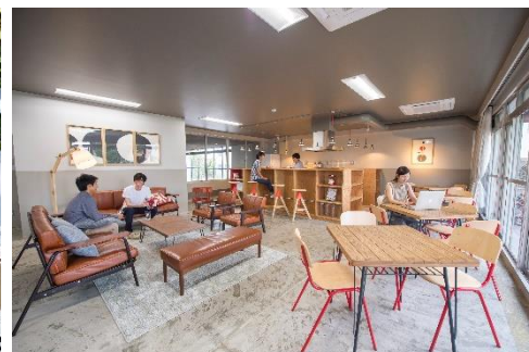
シェアプレイス調布多摩川