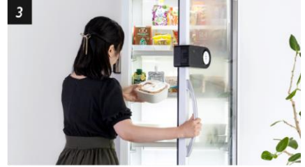
3 あとは商品を受け取るだけ！

TukTuk は、マンションやオフィス等の共有部に小型のショーケース店舗を設置することで無人販売を実現するコンビニエンススタンドです。お弁当やデザート、ドリンク、お菓子などの食料品や日用品など、利用者のニーズに合わせて幅広い商品を取り扱っています。