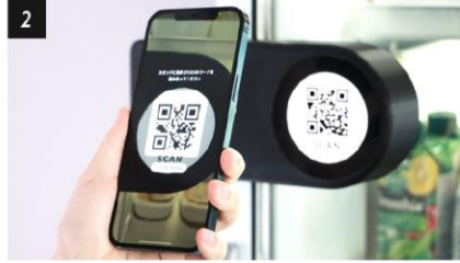
2 QRコードを読み取って スタンドの鍵を解除