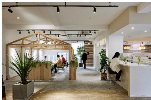
シェアプレイス田園調布南

シェアプレイス東神奈川 99 / シェアプレイス田園調布南 / シェアプレイス三鷹 シェアプレイス調布多摩川 / シェアプレイス聖蹟桜ヶ丘