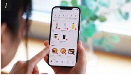
1 アプリから好きな商品を選んで 購入しましょう