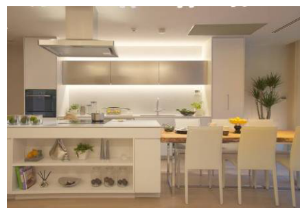
▲「ルクラス代々木上原」