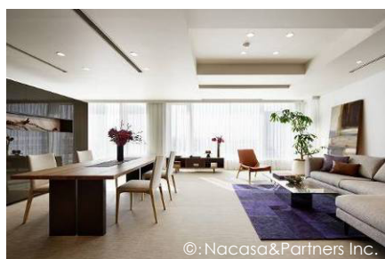
▲コンセプトルーム1