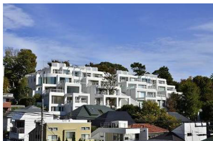
▲瀬田ファーストの外観