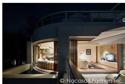
▲コンセプトルーム 2