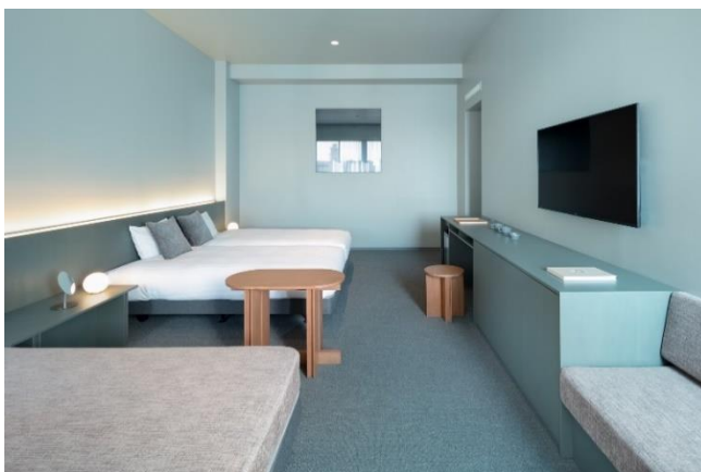
左：1Fアートストレージ 右：客室の一室（Superior 4）