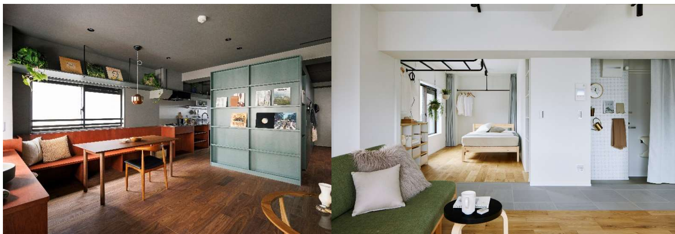
ファンド保有物件：左：PATH 駒込 | 右：PATH 浅草

※1 ファンドの保有物件に対して、バリューアップ改修のサポートを継続的に行う役割を指します