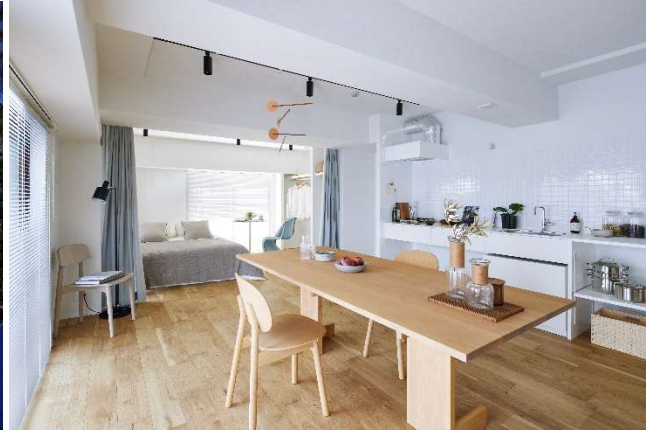
左上：共用エントランス | 右上：くるっと一周、広くて明るいワンルーム（PATH 駒込） 左下：共用エントランス | 右下：生活スタイル毎にレイアウトが自由な空間（PATH 浅草）