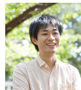
最新刊『日替わりオフィス』(幻冬舎)も好評発売中の作家・田丸雅智氏が BUKATSUDO 初登場