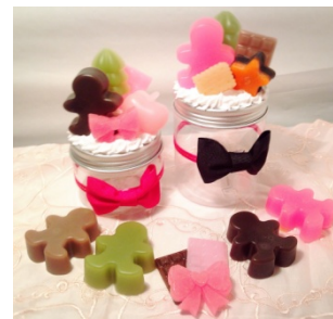
ハンドメイド部 クリスマススイーツデコレーション