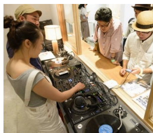
イベントBGMを担当するレコード部には体験入部も可能