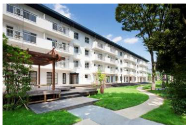
築50年のUR団地再生「りえんと多摩平」