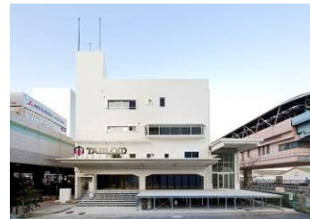
オフィス商業複合施設「TABLOID」