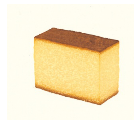
木版画の魅力を実感できる、彦坂木版工房「木版画でカステラを描こう」