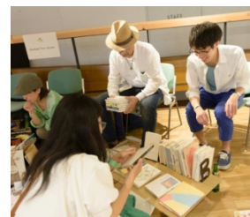
前回のひとはこ古本市の様子