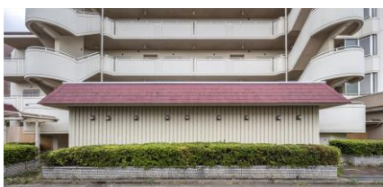
▲Before 建物前にトランクルームがあり閉鎖的。

「リノア武蔵野」は、武蔵野市の魅力的な自然環境や子育て環境の立地特性を活かして、「家族の学び家」をコンセプトに、子どもも大人も地域の人も、みんなが集まることを目指したシェアスペース“manabino(読み:マナビノ)”を共用部に備えた、当社48棟目の「一棟まるごとリノベーションマンション」です。当社では、2005年より「一棟まるごとリノベーション分譲事業」を開始し、当事業の仕組みでグッドデザイン賞を受賞、本物件含み48棟1,500戸の企画・供給実績となります。