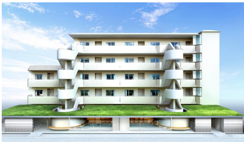
▲After 共用部manabinoを増築。道路沿いの壁は、街並みを映す鏡面仕上げ。