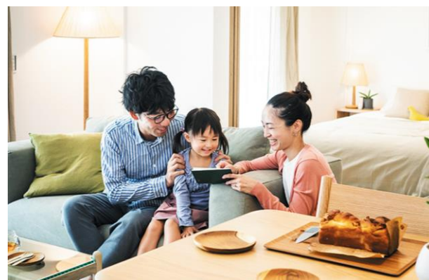
▲モデルルーム室内写真