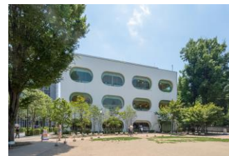
図書館、生涯学習センターなどの複合公共施設「武蔵野プレイス」

年間を通して大人も子どもも楽しめるイベントを開催していきます。4月には、武蔵野プレイス内のカフェ店主が武蔵野プレイスからリノア武蔵野まで案内する武蔵野まち歩きや、ドローンのスペシャリストを講師に招いたミニドローン操縦体験会などを開催する予定です。