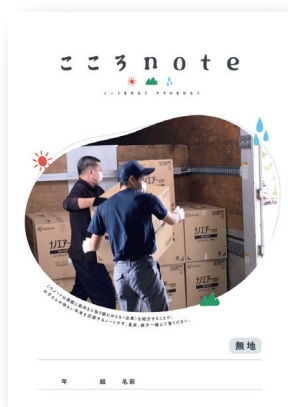
アイリスオーヤマ