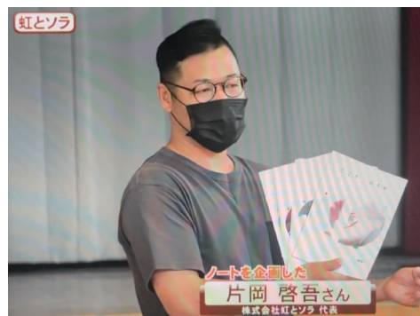
2022.5 第一弾取材の様子