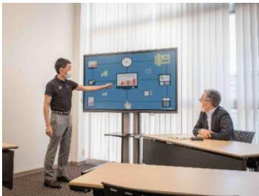
「メルセデス・ベンツ長野」

テレビの基幹部品やディスプレイを提供する世界のリーディングカンパニーである广州视源电子科技有限公司、略称：CVTEの自社ブランド「MAXHUB（マックスハブ）」は、インタラクティブ・フラットパネル（IFP）「All in One Meeting Board V6 Classic」をメルセデス・ベンツ長野、中勢製氷冷蔵株式会社、三洋自動車株式会社の3社が導入したことを発表します。