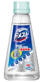
ドメスト 室内用多目的除菌スプレー つけかえ用