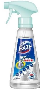
ドメスト 室内用多目的除菌スプレー