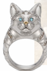
右：リングをはめてご満悦のライちゃん 左：ライちゃんリング 瞳はパライバトルマリン、毛並みはブラウンダイヤで表現

カーなど多くのオーダーをいただいています。中でも取引先の方の似顔絵を入れたキーホルダーは、ご本人があまり気に入ってしまい「傷がつかないようにペンダントにしてほしい」と、プレゼントした翌日ケイウノにリフォームの依頼をされたのだとか。そんな菊池さんが「ジュエリーの新しい価値を創造したい」とお話されるのが、スマートフォンの光を使って灯すランプです。