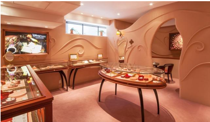
▲全国4店舗に併設するディズニージュエリーコーナー

ケイ・ウノは、2010年よりディズニージュエリーのオーダーメイドを手がけ、これまで6万種類以上のディズニージュエリーを生み出してきました。専門の「ディズニージュエリーコーナー」を全国4店舗（新宿東口店、横浜元町店、栄店、神戸店）に設置しています。全国38店舗のケイウノ及びオンラインショップでもディズニージュエリーを取り扱っています。