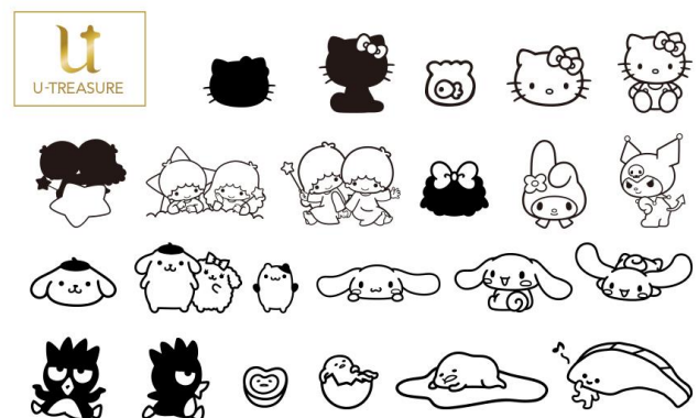
DIY（手作り体験）ジュエリー、マーク事例（全 150 種類）