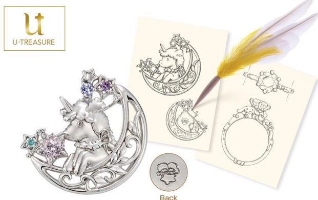
オーダーメイド参考事例、デザイン画

サンリオキャラクター23種類から好みに合わせて、ユートレジャー専属のジュエリーデザイナーが、リング（指輪）、ネックレス、ピアス、バングルなどのデザイン画を描き提案する（デザイン・見積り無料）ほか、店舗に併設されたジュエリー工房にて、リング（指輪）、ネックレス、バングルを職人のサポートのもと製作するDIY（手作り体験）サービスを展開します。