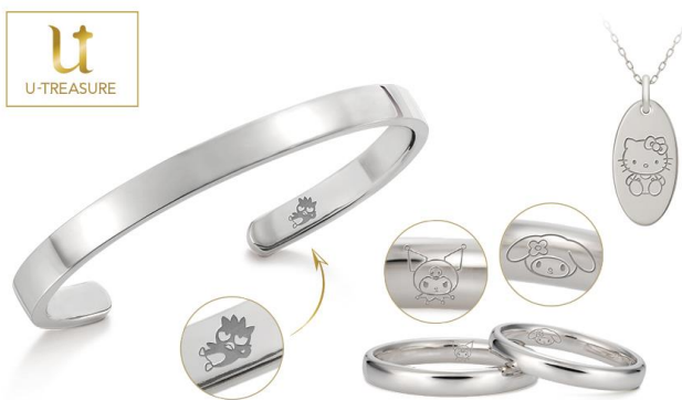
DIY（手作り体験）ジュエリー参考事例