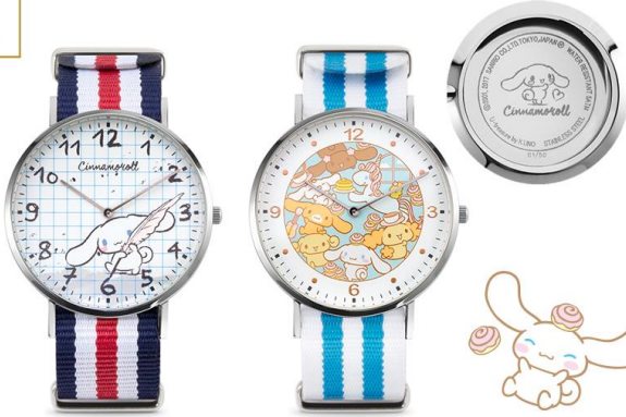
ユートレジャーオリジナル・シナモロール腕時計