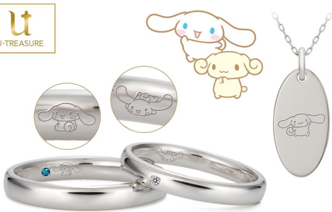
DIY（手作り体験）ジュエリー参考事例