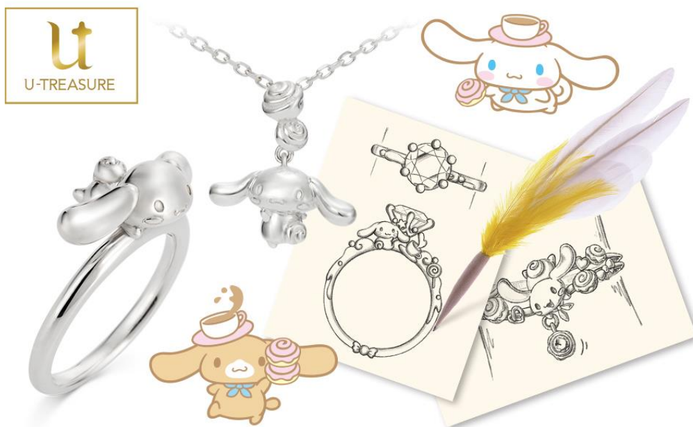
左) ユートレジャーオリジナル・シナモロールジュエリー、右) シナモロールのオーダーメイドジュエリーデザイン画

http://www.u-treasure-onlineshop.jp/news/cinnamorollbirthdayfair2018/