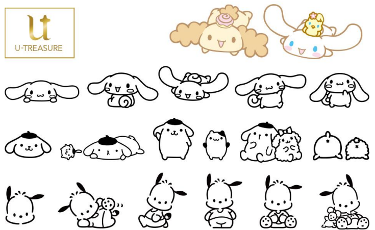
DIY（手作り体験）ジュエリー、デザイン事例（全150種類）