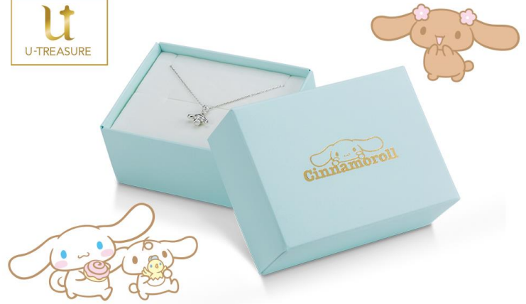
ユートレジャーオリジナル・シナモロールジュエリー専用 BOX

©'75, '76, '79, '84, '85, '88, '89, '93, '96, '99, '01, '04, '05, '10, '11, '12, '13, '18 SANRIO CO., LTD.