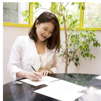
ジュエリーデザイナーがデザイン画を描く

ハローキティ、リトルツインスターズ、マイメロディ、クロミ、マイルスイートピアノ、いちごの王さま、ポムポムプリン、シナモロール、ポチャッコ、KIRIMIちゃん、ぐでたま、イチゴマン、シュガーバニーズ、ウイッシュミーメル、パティ&ジミー、バッドばつ丸、タキシードサム、ぼんぼんりぼん、ディアダニエル、チャーミーキティ、けろけろけろっぴ、みんなのたあ坊、ハンギョドン