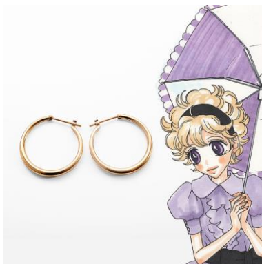
どんなファッションにも合わせやすい華やかなイエローゴールドのバニラ ver.