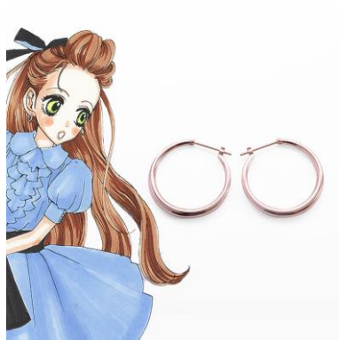
エレガントな中に女性らしい可愛らしさをイメージしたピンクゴールドのショコラ ver.