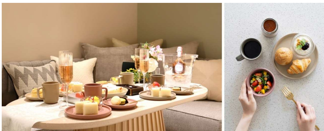
（左）客室での飲食の様子、（右）朝食の内容

朝食では、西池袋のフレンチの人気店「Cheval de Hyotan」（ミシュランガイド東京ビブグルマン選出歴有）との協業によるスープを提供します。