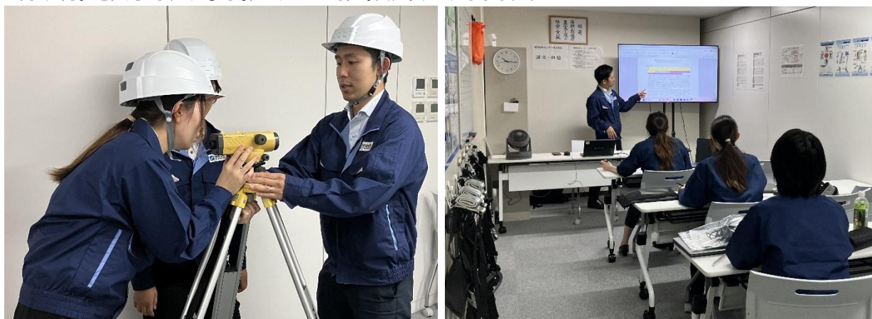
測量機器を使用した実技研修

また、開設に伴い実施したメディア関係者向け研修見学会では、実際の研修風景を公開したほか、日立グローバルライフソリューションズ株式会社をお迎えしたトークセッションを通じて、九州・福岡エリアの建設業界の現状と人手不足による影響についてディスカッションしました。