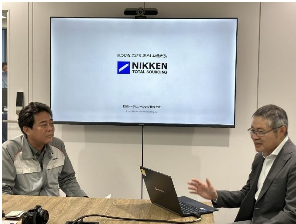
トークセッションのようす

トークセッションでは「福岡の建設業界の現状と人手不足による影響について」をテーマに、業界が直面する深刻な人材不足に伴う課題や人材育成、今後の展望などについて、現場のリアルな視点で深くディスカッションしました。