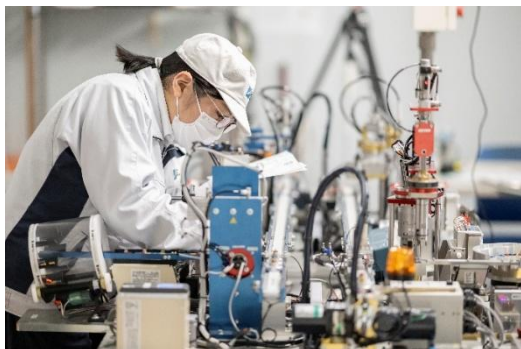
FA 機器を使用した実習の様子