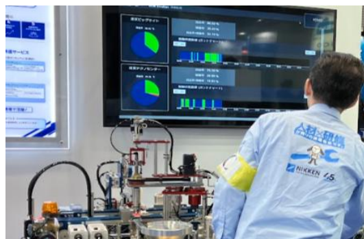
FA 機器の稼働状況をモニタリングしている様子