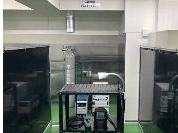
研修で使用する TIG 溶接機

広島県広島市、呉市、山口県下松市、愛媛県今治市などを中心に鉄鋼・造船などの産業が集積する中国・四国エリアでは、溶接技術を持つ人材への需要も高く、安定した人材確保が喫緊の課題となっております。