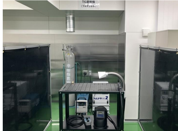
研修で使用する TIG 溶接機

広島県広島市、呉市、山口県下松市、愛媛県今治市などを中心に鉄鋼・造船などの産業が集積する中国・四国エリアでは、溶接技術を持つ人材への需要も高く、安定した人材確保が喫緊の課題となっております。