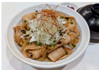
食欲そそるスタミナ丼