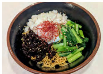
ニンニクと背油の背徳油そば