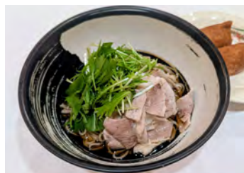
かぼす香る豚しゃぶ冷そば 稲荷寿司付