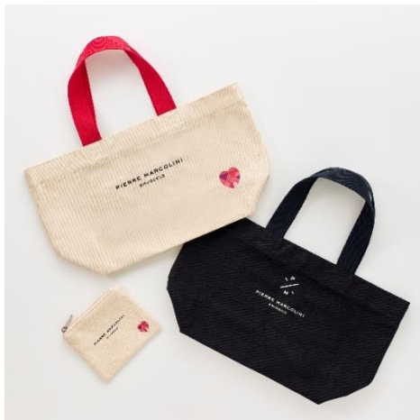
エコバッグ(黒・白)/ポーチ

※こちらの商品は直営店・百貨店催事場 (一部店舗除く)・オンラインのみでの販売となります。