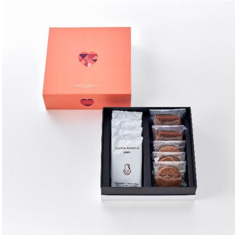
パティスリー セレクション (9個入り)

世界的なショコラティエでありながら 2020 年に世界最優秀パティシエ賞を受賞したピエール マルコリーニこだわりの焼き菓子の詰め合わせです。