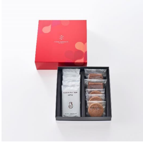
パティスリー セレクション 9個入り

ショコラティエだけでなくパティシエのディプロマも持つピエールマルコリーニ。こだわりのオリジナルクーベルチュールを使用したケーキショコラやサブレ ショコラなどの焼き菓子3種を詰め合わせました。