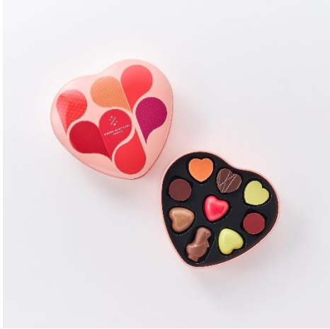
コフレ クール 9個入り

今年のバレンタインコレクションのテーマ「RELEASE YOUR HEART」のモチーフが可愛いハート型のパッケージに、新作の「クールヌーヴォ フリュイドゥラ パッション & フルールド オランジュ」をはじめ、定番人気の「クール シリーズ」などを詰め合わせた限定アソートメントです。