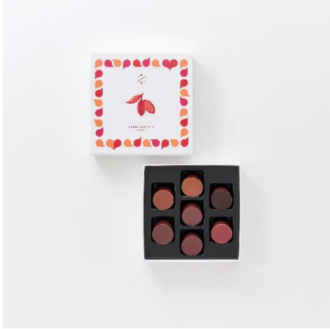
グラン クリュ セレクション 7 個入り

ピエール マルコリーニのこだわりのカカオを使用した「グラン クリュ シリーズ」6 種 7 粒を詰め合わせました。まるで世界を旅するような気分で、カカオ生産地の個性や味わいの違いを体感していただける「グラン クリュ シリーズ」が 2024 年バレンタインに合わせて産地ごとに異なる味わいをより感じられるようにレシピが新しくなりリニューアル。