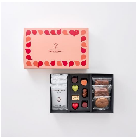
ショコラ & パティスリー セレクション (ショコラ 7 個 パティスリー 6 個入り)

こだわりのカカオから作られたショコラと、オリジナルクーベルチュールを使用したケーキ ショコラなどの焼き菓子を詰め合わせた贅沢なセット。