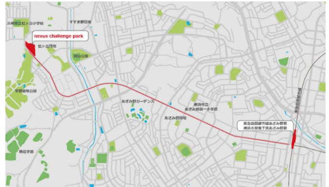
「nexusチャレンジパーク早野」位置図