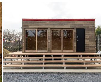
3. nexus Lab