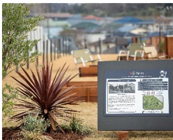
1. Niji Farm

自然の立地をそのままに活用した、生き物のためのエリアです。養蜂や、腐葉土づくりとカブトムシの育成など自然の生態系を学び、楽しむことに加え、たとえば蜂蜜を使った商品づくりなど、様々な「遊び」の循環へもつなげていく空間です。