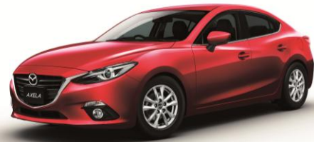
▲ 新型「マツダ アクセラ」

「マツダ アクセラ」は、発売から約10年の間、走りを楽しむドライバーに選ばれ、世界120カ国、370万台以上販売※2されている人気の高い車種です。今回の新型「マツダ アクセラ」は、意のままにクルマを操る『人馬一体』を理想に開発され、マツダの最新技術全てがつぎ込まれています。