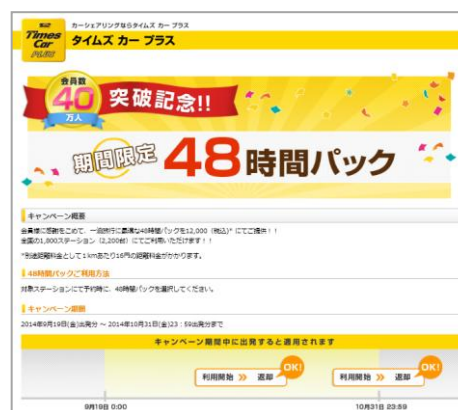
▲キャンペーンサイトイメージ

http://plus.timescar.jp/campaign/member201409/