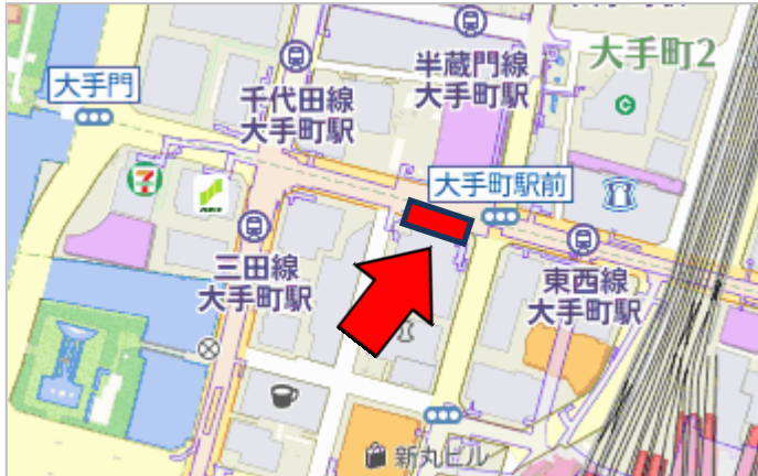
Z16LA 第 445 号 Copyright(c)2016 ZENRIN CO.,LTD