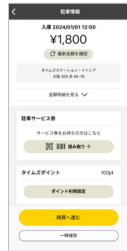
▲駐車サービス券読取りメニュー画面