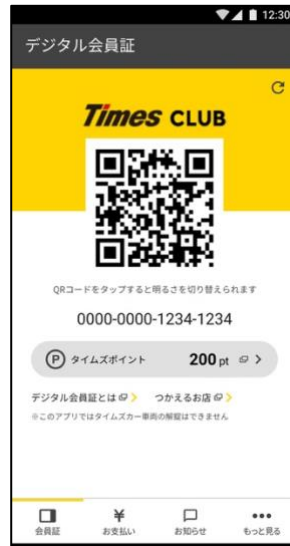
②「お支払い」をタップ