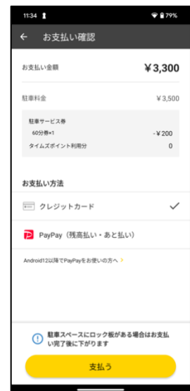
⑧事前登録済みのクレジットカードもしくはPayPayで支払い