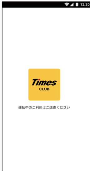
①タイムズクラブアプリをダウンロード