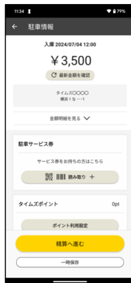
⑥駐車サービス券読み取りをタップしてQR・バーコードを読み取り