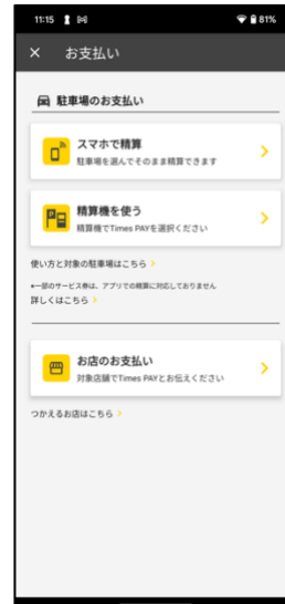
③スマホで精算をタップ