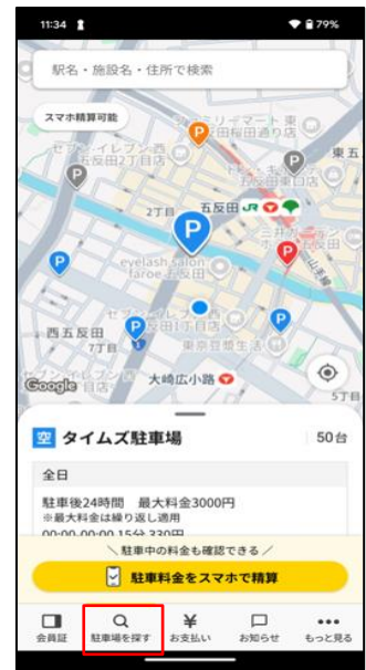
▲駐車場検索画面イメージ

※2 タイムズクラブアプリを通じて料金を精算できる駐車場は、Webもしくはタイムズクラブアプリ内で検索できます。