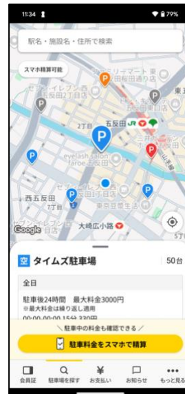
③ 駐車料金など詳細情報を確認