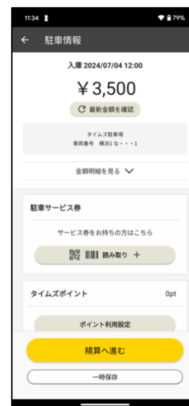
⑦ 駐車料金を確認。サービス券などがあれば読み取り