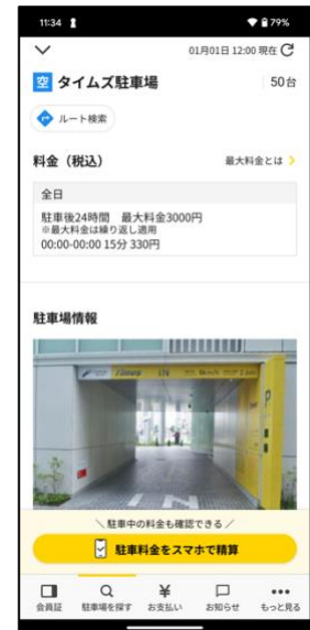
④ 駐車場に到着、駐車情報を確認