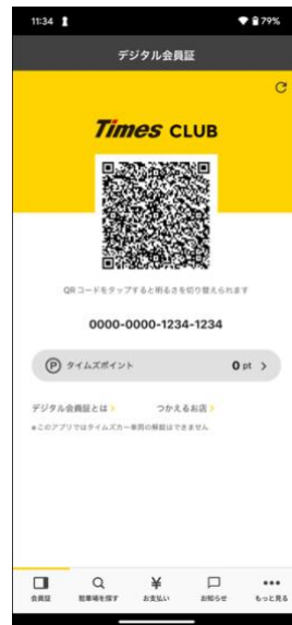
② 「駐車場を探す」をタップ