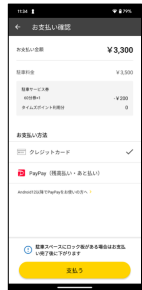
⑧ 事前登録済みのクレジットカードもしくはPayPayで支払い