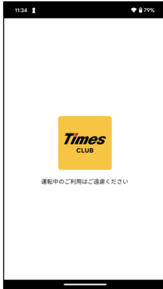
① タイムズクラブアプリをダウンロード