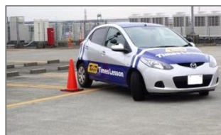
▲①右左折によるバック駐車