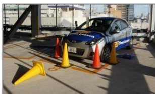
▲④クルマの死角確認体験