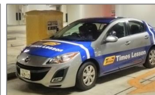
▲②精算機への寄り付き