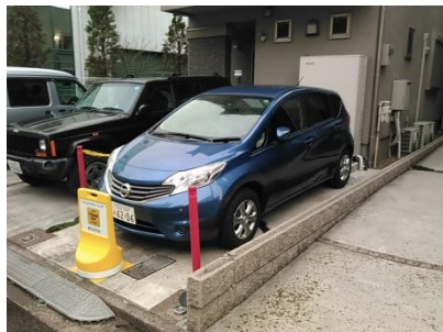
【写真1：タイムズカープラス】