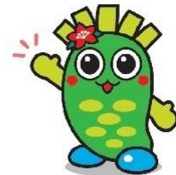
奥多摩町イメージキャラクター わさびー